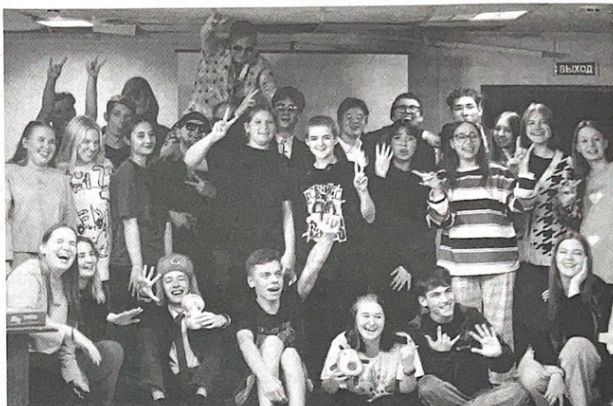
Живем как семья! Студенты СГУ имени Н.Г.Чернышевского

- «Семейное гнездышко» - это конкурс, в котором помимо испытаний есть образовательная программа, - рассказала начальник отдела социаль-